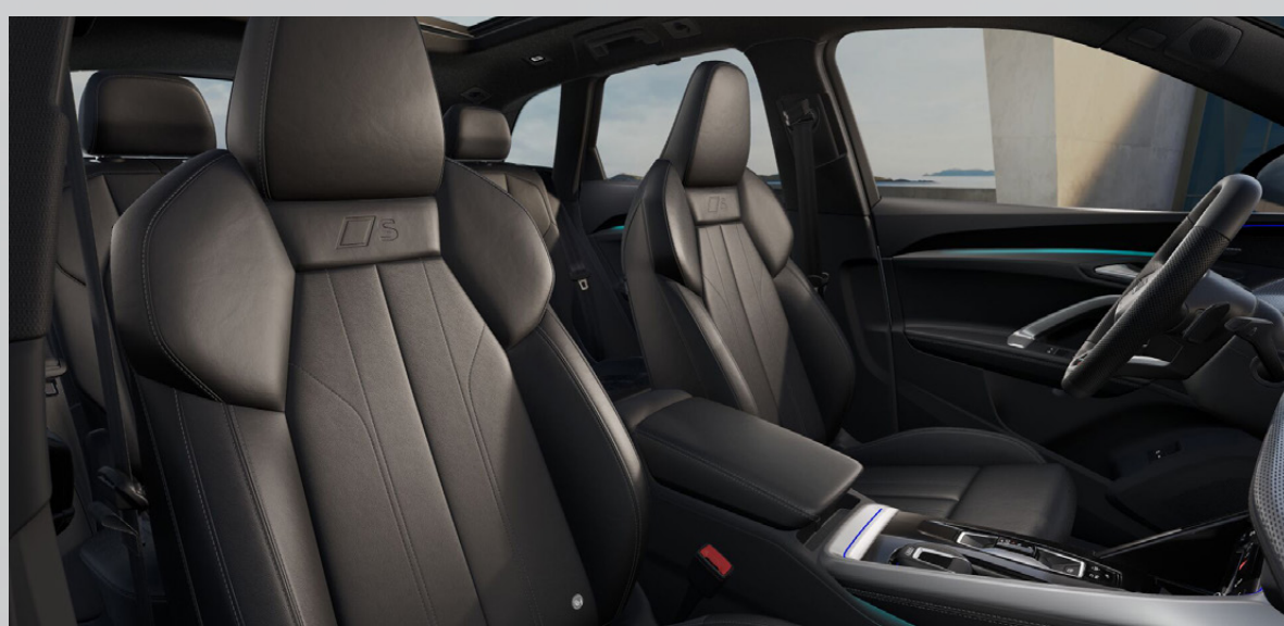
Black with stitching in Steel grey (GX)

*Optional extras รายการสีสิ่งพิเศษ ซึ่งมีค่าใช้จ่ายเพิ่มเติมจากราคาขายแนะนำที่ระบุไว้ในใบราคา