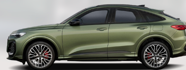
District green, metallic (M4M4)