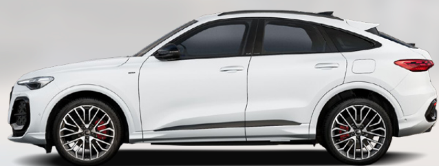
Glacier white, metallic (2Y2Y)