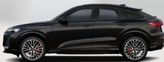
Mythos black, metallic (0E0E)