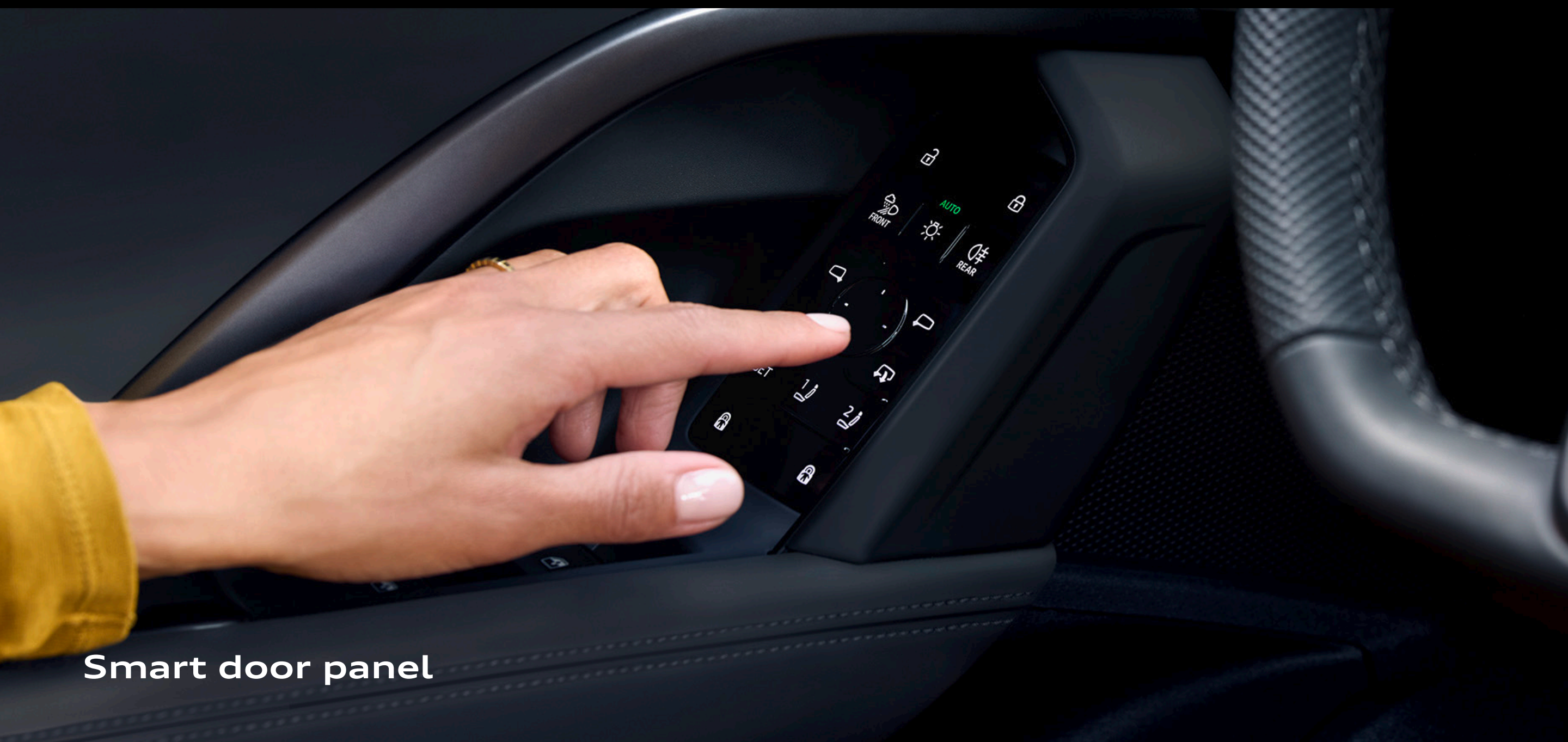
Smart door panel