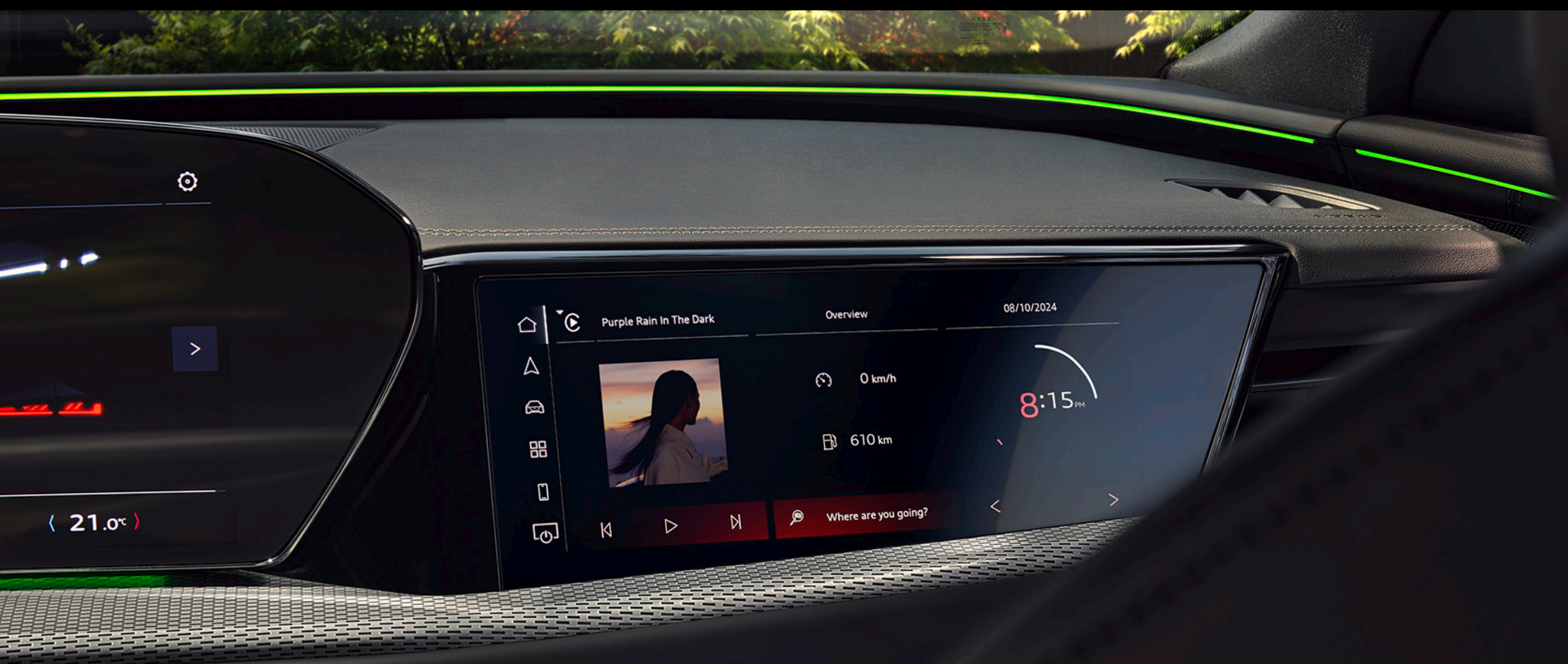
MMI front passenger display

Curved MMI Panoramic Display เปิดมุมมองใหม่ให้กับผู้ขับขี่ ลงตัวกับทุกการใช้งาน เสริมด้วย MMI front passenger display ที่โอบล้อมทุกมุมมอง ตอบสนองความต้องการของผู้ใช้ในทุกมิติ พร้อมยกระดับบรรยากาศทุกการเดินทางด้วย Ambient lighting ที่สามารถปรับได้ถึง 30 เฉดสี เสริมด้วย Dynamic interaction light ที่แสดงสถานะการชาร์จแบตเตอรี่ และระบบไฟเลี้ยง