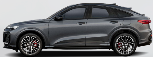
Daytona grey, pearl effect (6Y6Y)*