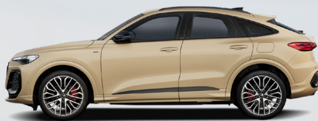
Sakhir gold, metallic (2Z2Z)*